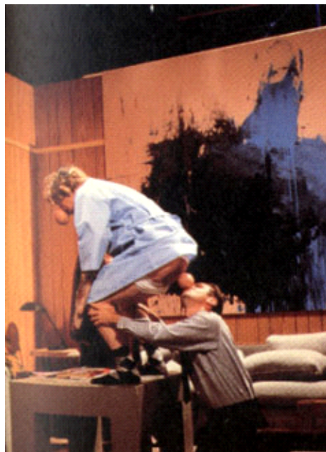
Paul McCarthy: „Performance – Painter“, 1995

Und das ermöglicht bzw. erleichtert ihnen die sog. demokratische Aufarbeitung der Kulturgeschichte des Dritten Reiches, die Umerziehung zu grenzenloser Liberalität und geistiger Freiheit, welche in Wahrheit eine Erziehung zu einer weiteren geistigen Unfreiheit wurde.