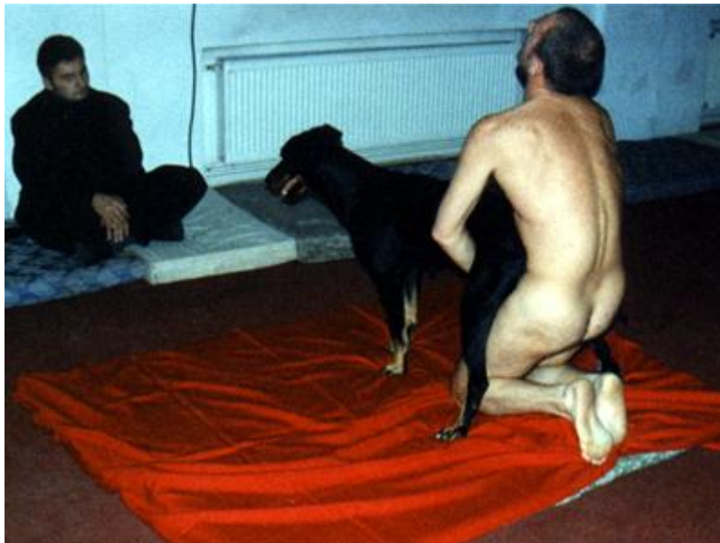
der Russische Performance „Künstler“ Oleg Kulik ; man beachte den aufmerksamen, aufgeschlossenen Kunstszepienten im Hintergrund

Dies sind nur ein paar - zugegeben - ziemlich willkürlich herausgegriffene Beispiele aus dem Bereich der heutigen „Kunst“szene, aber die Beispiele ließen sich unendlich erweitern. Die Frage ist: warum akzeptieren wir das alles - lassen dies alles über uns ergehen, obwohl wir - wenn wir versuchen ganz ehrlich zu sein, zugeben müssen, dass uns dies alles eigentlich überhaupt nicht interessiert, uns nichts angeht, ja sogar in Wirklichkeit oftmals ganz stark gegen unser persönliches Empfinden und unseren persönlichen Geschmack verstößt. Protestieren noch nicht einmal, wenn wir hören (lesen), dass das städtische Museum xy dafür tausende von Euros (Steuergelder) hinblättern musste.