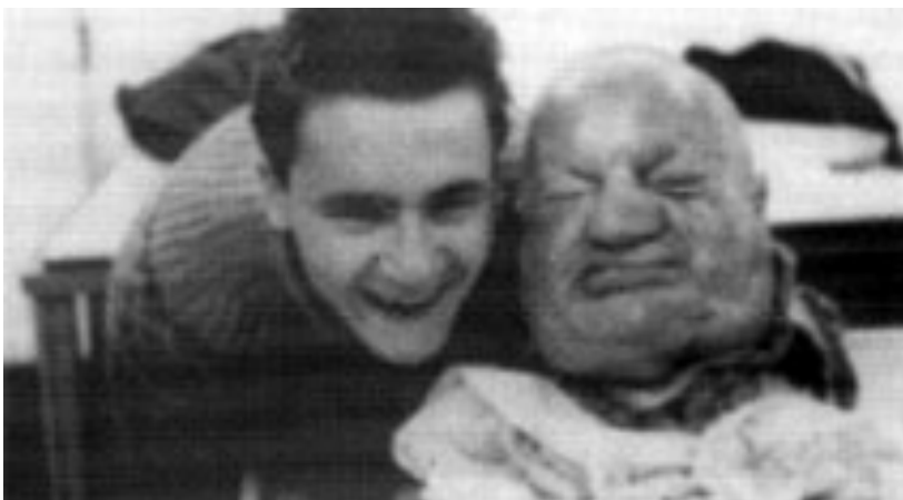
der englische „Shooting-Star“ der Kunstszene der neunziger Jahre: Damian Hirst, mit dem abgetrennten Kopf einer Leiche

Wir sind heute endlich tolerant und akzeptieren ALLES.